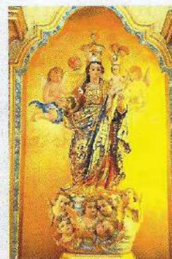
Capela de Nossa Senhora do Rosário