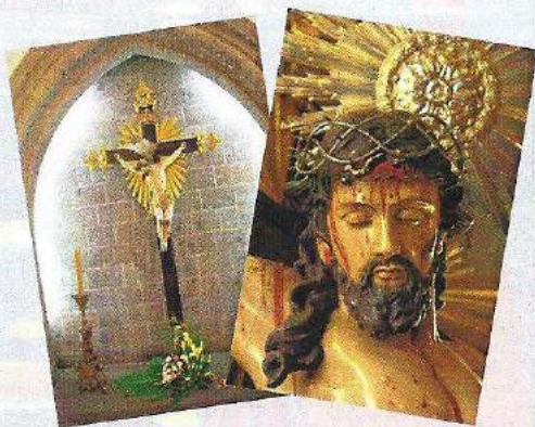
Capela do Bom Jesus, antes Altar do Menino Jesus