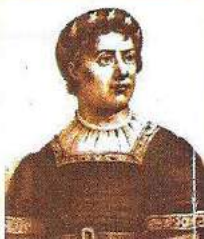
Infante D. Pedro

Esta foi construída no local onde se situa hoje a Praça Bento Góis.