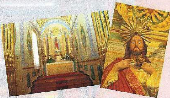
Capela do Sagrado Coração de Jesus, antes Capela do Santíssimo Sacramento