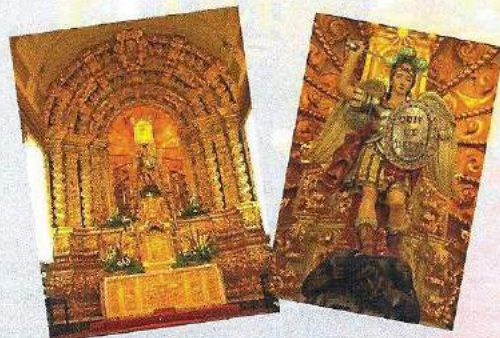
A Capela – Mor, com o arco triunfal gótico, e uma notável obra de talha dourada, ladeada por um conjunto de painéis de azulejos

No seu interior encontram-se três naves e a capela – mor, ligada a outras duas laterais. A nave principal está separada das laterais por colunas simples encimadas por arcos ogivais, elemento preponderante no estilo gótico. Cada nave tem no fundo o seu altar, ficando na do centro o principal ou maior, onde se venera e presta o culto ao Glorioso Arcanjo São Miguel, Patrono da Vila e padroeiro da Ilha.